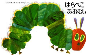
エリック・カール著 偕成社