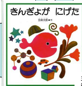
五味太郎著 福音館書店