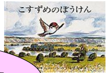
ルース・エインズワース著 福音館書店