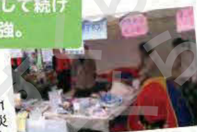
すくらむ21まつりに親子防災のブースを出展。

ノートパソコンを持ち歩いて合間に編集の仕事をしたり、本屋さんにリサーチに行ったり