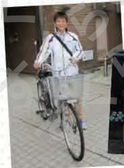
地域の相談者訪問には自転車が必要!

不安な気持ちを抱えた方の心をほぐせないときは悩むが、先輩方に相談したり、助言をいただいたりして乗り越えている。