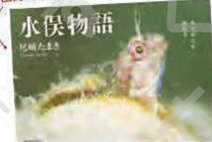
尾崎たまき(著)『水俣物語』新日本出版社