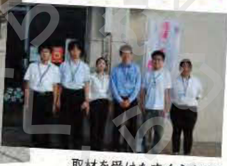
取材を受けたすくらむ21インターンシップ生と。

(注)保健師…保健師になるには看護師国家試験に合格した後、定められた保健師養成課程修了による受験資格を得て、保健師国家試験に合格すると保健師免許が得られます。