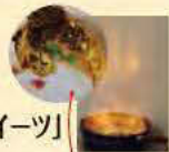
ホットチョコバナナ

総合政策学部で、ゼミでは異文化理解を戦略的に進めていく異文化マーケティングを勉強。