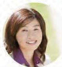
NPO団体代表/ライター