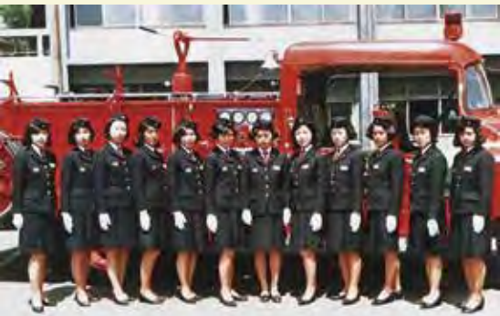
昭和 44 年に神奈川県消防学校へ入校した 12 名の女性

消防吏員とは、市町村の消防本部・消防署に勤務する消防職員のうち、階級を有し、消火活動中の緊急措置等、消防法上の権限を有する者をいいます。