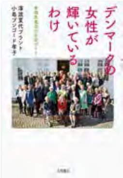
2020年6月発行 (著者) 澤渡夏代ブランド・ 小島ブンゴート孝子 (出版社) 大月書店 (価格) 1,800円(税別)