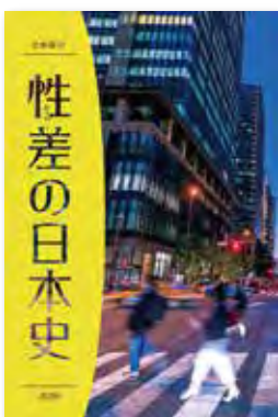
2020年10月発行 (編集) 大学共同利用機関法人 人間文化 研究機構 国立歴史民俗博物館 (価格) 2,273円(税別)

も有用。「共働きの家庭でない」と育休は取れない」や「休むのに給付金をもらおうと、会社に金銭的な負担をかける」も誤解の例だ。企業に男性の育休を義務づけることは、希望する男性の育休を叶えるだけでなく、日本企業が生産性を上げて業績を伸ばすことにつながるという。男性社員の育休取得率100%、残業ゼロを実現し、人材採用に成功した中小企業の事例も紹介されている。企業経営者、政策担当者、人事担当者だけでなく、今後よりよい日本社会に暮らしたい人間には必読の書と言える。