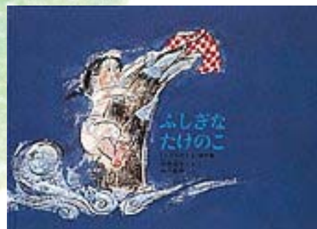
作・松野正子、絵・瀬川康男 出版 福音館書店

五月から七月の頃、たけのこを見ながら夢を膨らませ、子どもたちにも読んでおきたいし、大人になっても、ほっこり笑いが生まれる絵本です。