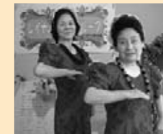
◎ レイナニ・フラグループ 「レイナニ・フラグループ」

壁面展示品:1日でおぼえるやさしい振り付けテキストと小物(髪・首かざりは練習時使用)内容:歌や音楽に慣れ親しみフラの醍醐味を知り、自然にほころぶ笑顔(ミノアカ)と心からの自己表現による自由スタイルのフラを仲間と楽しもうという趣旨。他に鳴り物(ひょうたん・スティック)によるフラもご紹介中!