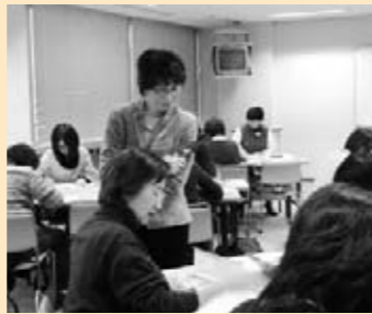
◎ ウーマンズアイ 「気軽にカラーセラピー~すてきな自分に出会えます~」

川女連では、昨年に引き続き防災をテーマに学習。大雪の当日は防災気象情報モバイルサイトは大活躍。サントリーフーズ(株)の自動販売機を通じた防災への貢献に納得!一番大切なのはやっぱり地域のひとと人のつながり♪