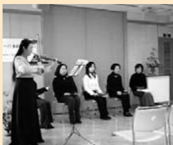
◎ NPO法人 ウィメンズハウス・花みずき 「ひまわり~DVをのりこえて」朗読&バイオリン演奏

青年の過半数がワーキングプア、過酷な病院勤務の事例報告の後、「働きたい!でも保育園に入れない…」というお母さんの発言から、現実を変えなければ「仕事と生活の調和」もないと沢山の意見に沸きました。