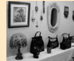
◎ コスモス 「レザークラフト」

お仲間の皆さんと楽しく作ったベルト、バック等小物から鏡、額絵等の大作を展示して皆様に見ていただく機会を得て、とてもうれしく思います。明るく楽しい教室です。お近くの方々一度体験なさってみませんか。