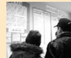
◎ 特定非営利活動法人グループ・ビボ 「地域で考えよう。家庭のこと。話して!聞いて!これってDV?虐待?」

DVが子どもに及ぼす影響について展示し、関連本も展示しました。DVや虐待についての質問を受ける場面もあり多くの方々に関心を持っていただくことができました。恒例チャリティバーナーも大盛況。来年も楽しみにしています。