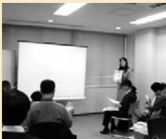
◎ 川崎市地域女性連絡協議会 「地震にそなえ、命を守るために」

DV被害者達の声を朗読、そしてヴァイオリン演奏。映画「ひまわり」、ユーモレスクなど、女性と子供を支える想いの伝わる音色が、30人余の心に響きました。DVに関心を持つ高校生からの質問も印象的でした。