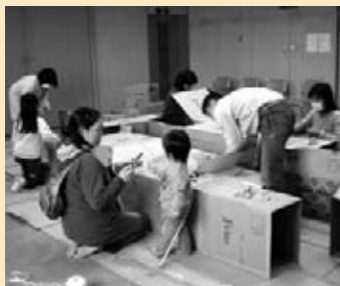
◎ NPO法人ままとんきっす 「お父さんと遊ぼう!ダンボール基地」

雪の悪天候の中、参加していただいた受講者に感謝したい。知識ではなく「気づき」を感じてもらおう努力をしたつもりです。本日の受講者の中からセミナー企画をされる方がいらしたらうれしい事です。