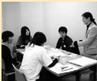
◎ 日本女性技術者フォーラム 「私が変わるワークショップ」

私たちはすくらむ21で2007年に行われたインターンシップ研修を通じて出会いました。今回のすくらむ21まつりでは、オリジナル映像とワークショップを通して、「働くこと」について皆さんと一緒に考える時間を設けることができました。雪の中多くの方々にご参加して頂き、まことにありがとうございました。