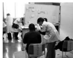
からだリラックス