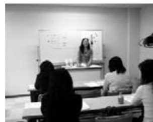
派遣レクチャーとミニ登録会

で、母子ともに楽しんで学べるイベントとなりました。今回は、事業の趣旨に賛同いただいた地元企業の協力により、参加者の皆様全員へノベルティグッズのプレゼントができました。この場を借りて厚く御礼を申し上げます。