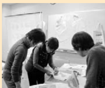
◎ PCさろんウエア 「地球環境はあなた次第!マイエコバックをつくろう!」

今回のメニューのパンシット・バナブックは一風変わった太いピーマンを使った料理、そしてギナタンはフィリピンを代表するココナツミルクを使ったお菓子で大好評。参加者の皆さん、文化を通じたフィリピン女性との交流にとっても満足されたようです。