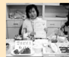
◎ はあ~もに~ 「Handmade Soapの紹介、販売」

1人でも多くの人にHandmadeのマルセイユ石けんの良さを伝えて頂きたいという主旨は叶えられたかなと思います。自然界に存在する物だけで作られた石けんがどんなに身体によいのか、そして環境によいのか。一緒に作って愉しんでみませんか。