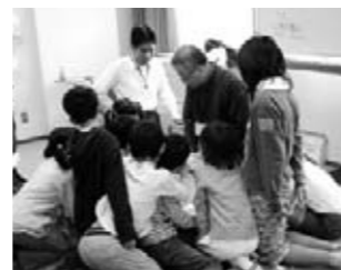
小学生マネー講座