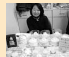
◎ ベルフラワー 「シュガーケーキのPR、販売」

「特別なお祝いの日の為にシュガーケーキをプレゼントに」をコンセプトに生の反応を知りたく参加しました。結果、好評だったと思います。今後、皆様の目にもっと留まるよう展開していきたいと思えます。