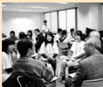
◎ 07年インターンシップ研修生OB,OG 「しゃべりば21」

ご来場いただいた方に整理券をお渡しし順次パソコン操作いただいでバッグの画像を作成。それを印刷指示をして切り取り布製バッグに転写して出来上がり。スタッフがお1人ずつアドバイス。お子さん連れの方が多く、出来上がったのをみて、みなさんうれしそうでした!