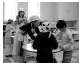
小学生クッキング