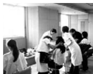
メイクアップレッスン (協力) AIAI満のロナリスビューティーステーション