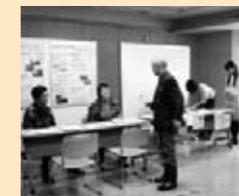
◎ かわさき市民活動センター 「市民活動相談」

市民活動相談は、具体的な相談はありませんでしたが、すくらむ塾の方や来場の方と意見交換ができました。また、市民活動センターの活動と助成金募集の広報ができました。