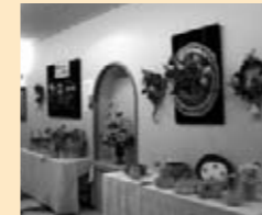
◎ 藤工芸トバース 「伝承と仲間の作品」

すくらむ21川崎市民講師事業後のサークルです。自然の温かみのある藤素材を使ってバスケットから藤花まで様々な編み方を通して藤のおもしろさを学び楽しんでいます。お仲間大歓迎しています。1日体験してみませんか。会費1,500円、毎月第1・3月曜日午後1:1時半~4時。