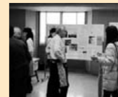
◎ すくらむ塾 「ポスターセッション」

すくらむ21開催の連続講座「すくらむ塾」受講生の皆さんが、川崎市の地域づくりについてそれぞれのテーマに沿った調査活動の結果をポスターセッション形式で発表いたしました。