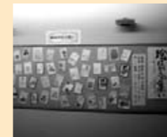
◎ 絵はがきの集い 「絵はがきの展示」

はがきに新聞紙、広告、絵の具、クレヨン何でもありです。暖かみのある作品を作り、50円で世界中に届けることが出来ます。あなたの居場所作りにも、一度見学(無料)にいらっしやいませんか?