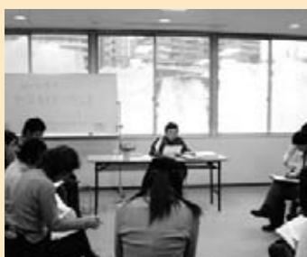
◎ かながわ女性会議&かわさきの男女共同参画をすすめる会 「私たちの望むワーク・ライフ・バランス」

悪天候にも関わらず20人以上の子どもたちが集まり、用意した段ボールを全て作って、大きな迷路や小さいトンネルなど楽しく作ることができました。