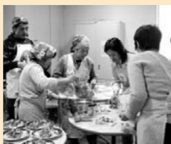
◎ カラカサン 移住女性のためのエンパワメントセンター 「フィリピン料理の体験と交流ワークショップ」

クレヨンを持つのは久しぶりという方もいきいきと描かれていました。受講者のリラックスした笑顔が印象的でした。 【参加者の声】 自分自身を見つめ直すいい機会になりました。他の方の思いも聞けてよかったです。